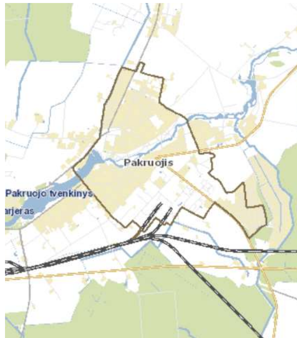
1 pav. Pakruojo miesto teritorijos ribų žemėlapis

Strategijos įgyvendinimo teritorija – Pakruojo miestas , yra išsidėstęs šiaurinėje Lietuvos dalyje, Šiaulių apskrityje, 36 km į rytus nutolusi nuo Šiaulių. Remiantis Lietuvos Respublikos žemės fondo 2022 m. sausio 1 d. duomenimis, bendras Pakruojo miesto plotas sudarė 351,61 ha, iš kurių žemės ūkio naudmenos sudarė 68,55 ha (19,49%), miškai (miško žemė) – 1,09 ha (0,31%), keliai – 25,67 ha (7,30%), užstatyta teritorija – 220,46 ha (62,70%), vandenys – 12,51 ha (3,56%), kita žemė – 23,33 ha (6,64%). Pakruojo miesto teritorija yra išsidėsčiusi 4 km 2 plote.